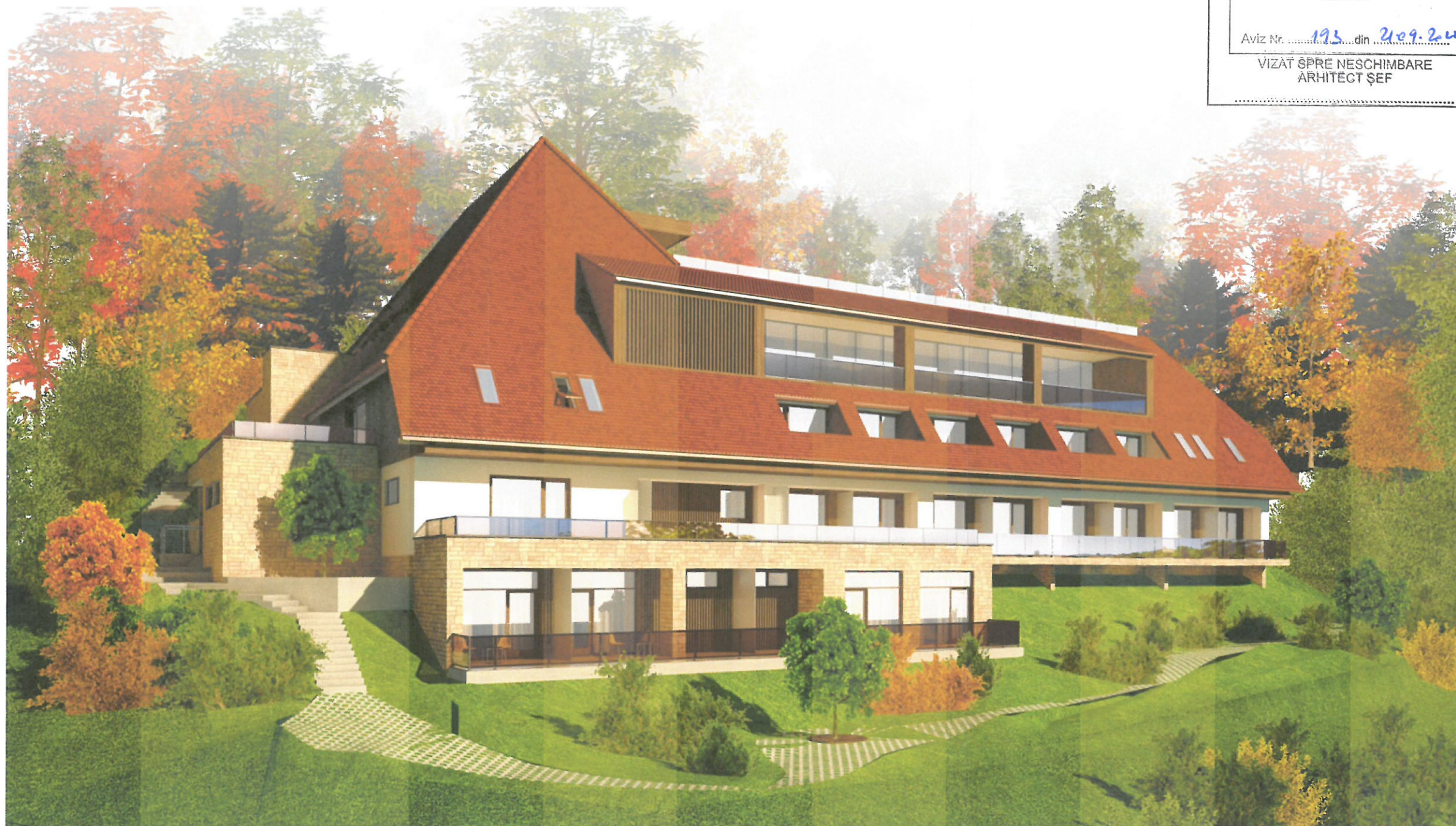
*Volumetrie revizuită - eliminare balcon orientat spre lac - nivel parter

CONSILIUL JUDEȚEAN CLUJ ANEXĂ Aviz Nr. 193 din 20.09.2022 VIZAT SPRE NESCHIMBARE ARHITECT ȘEF