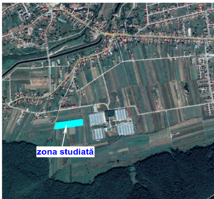
INCADRAREA IN ZONA

S total teren = 10100 mp extravilan, arabil Ac, Ad, POT, CUT = 0