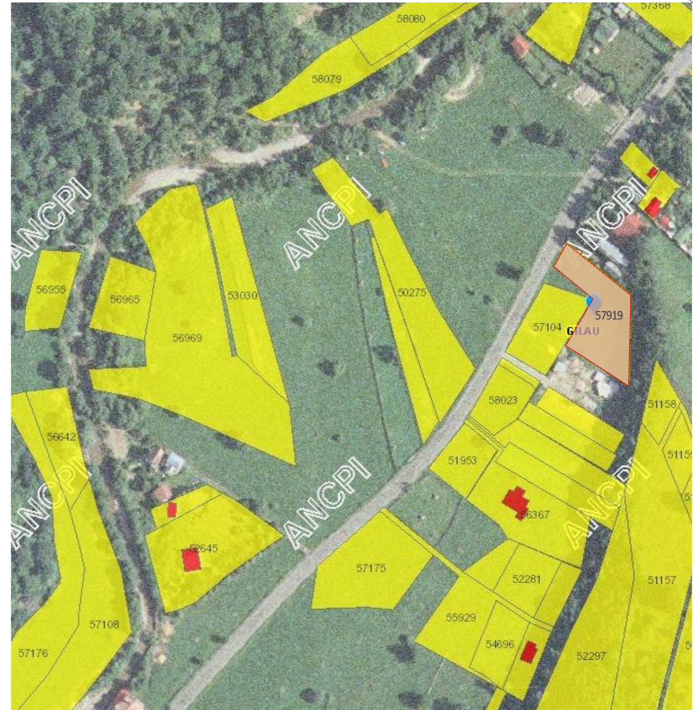
EXTRAS DIN PLANUL CADASTRAL