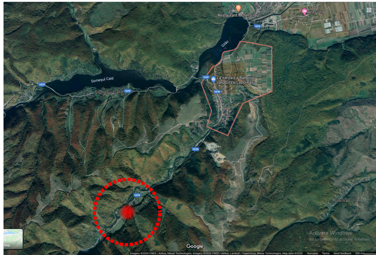
PLAN DE INCADRARE IN ZONA